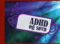
ADHD og søvn