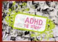
ADHD og piger