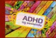
ADHD og søskende