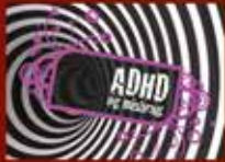
ADHD og misbrug