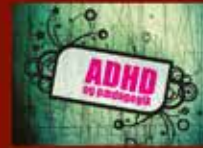
ADHD og pædagogik