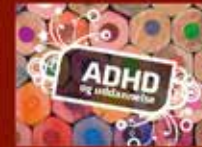
ADHD og uddannelse