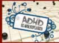
ADHD og arbejdspladsen