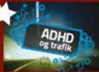
ADHD og trafik