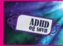
ADHD og søvn