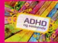
ADHD og søskende