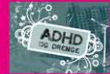
ADHD og drenge