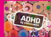
ADHD og uddannelse