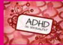
ADHD og seksualitet