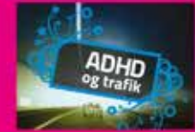
ADHD og trafik