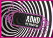
ADHD og misbrug