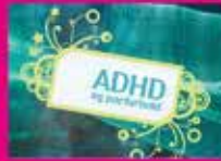
ADHD og parforhold