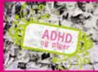
ADHD og piger